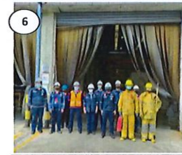
หัวหน้ากะตรวจสอบความเรียบร้อย ในการระงับเหตุเบื้องต้น จากนั้นแจ้ง ผอ.ก. ให้ทราบ และสรุปผลการ

5. สรุปรายรายชื่อผู้เข้าร่วมฝึกซ้อมระดับเหตุ และฝึกซ้อมอพยพ (กรณีไม่พอ โปรดแนบเอกสารแนบ)