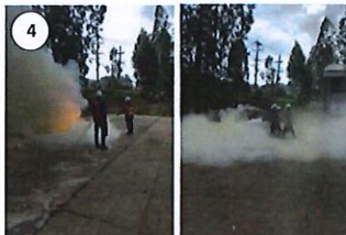
ทีมดับเพลิงประจำแผนก สามารถระงับเหตุ