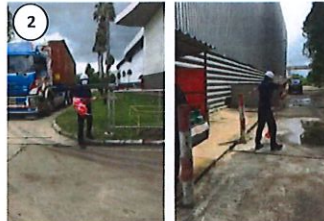
พนักงานทำการกั้นพื้นที่โดยรอบ เพื่อป้องกันบุคคลอื่นเข้ามาในพื้นที่