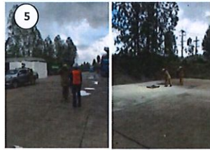
ทีมดับเพลิงเข้าเคลียร์พื้นที่ ตรวจสอบความเสียหาย และความเรียบร้อย ตรวจสอบว่าไฟดับสนิทแล้ว พร้อม