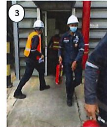
หัวหน้ากะแจ้ง ทีมดับเพลิงประจำ แผนกช่วยเหลือ ระงับเหตุพื้นที่ที่เกิดเหตุ