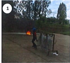
พนักงานผู้รู้ถึงพบว่าไฟไหม้เศษใบไม้แห้ง ที่ข้างโรงเก็บเชื้อ ไก่คัพพท์แจ้งหัวหน้ากะ พร้อมเข้าระงับเหตุเบื้องต้น ไม่สามารถ

4. สรุปรายการดำเนินการฝึกซ้อมระดับเหตุ และฝึกซ้อมอพยพ (กรณีไม่พอ โปรดแนบเอกสารแนบ)